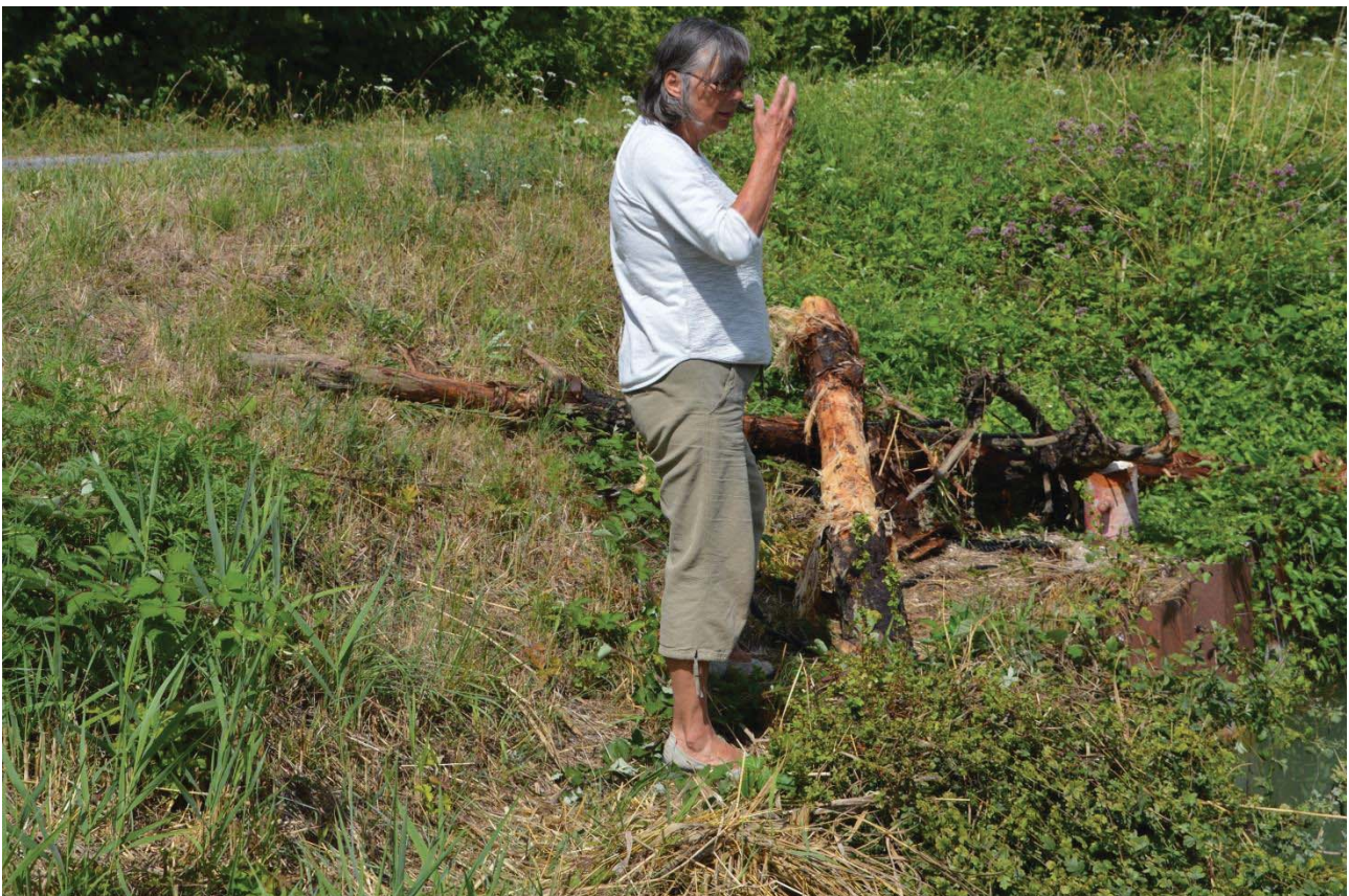
Den må vi have en tår på (vand)