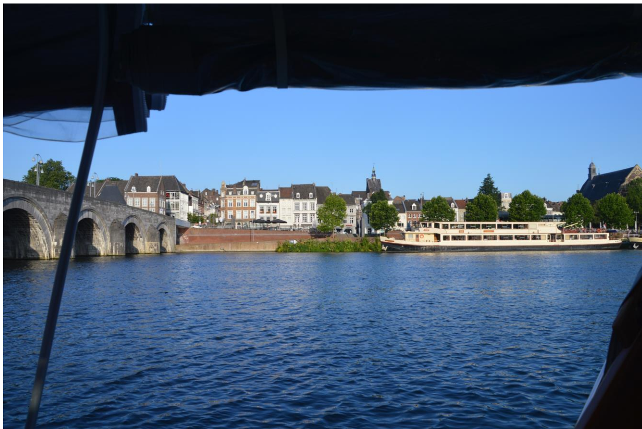
Udsigt fra båden i Maastricht

Fra Massbracht videre til Maastricht en virkelig flot by med alle de dyre forretninger, hvor man kunne ligge gratis midt i byen ved en mole midt i floden med en fabelagtig udsigt.