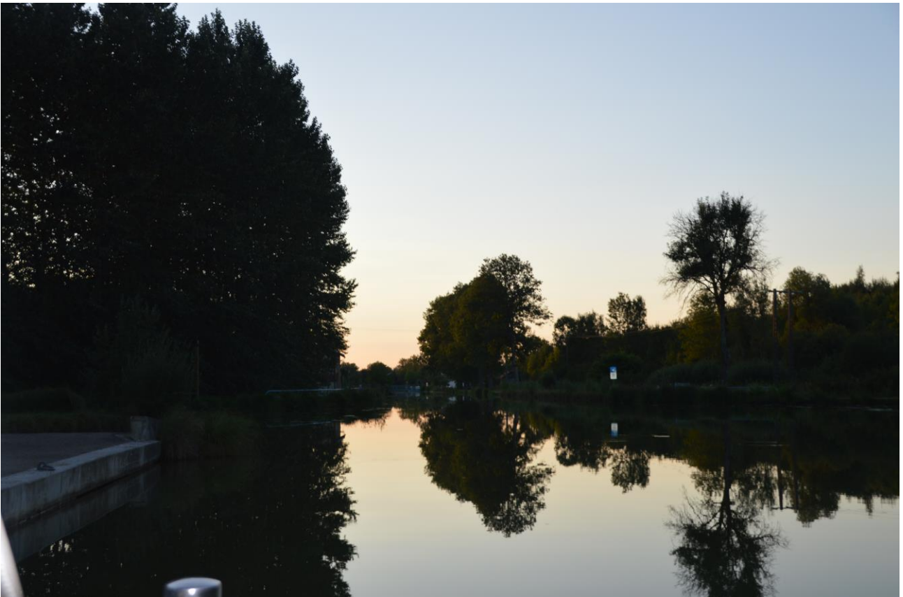
Aftenudsigt i fra cockpittet i Langres

I dag er vejret dårligt, torden, regn og blæst, de samme siger udsigten for i morgen så vi tager endnu en dag her.