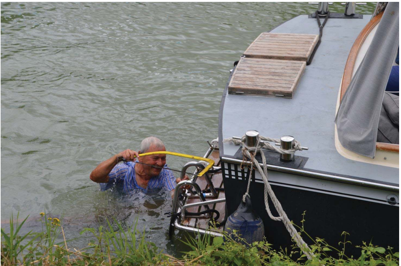
Arne saver og falder i vandet