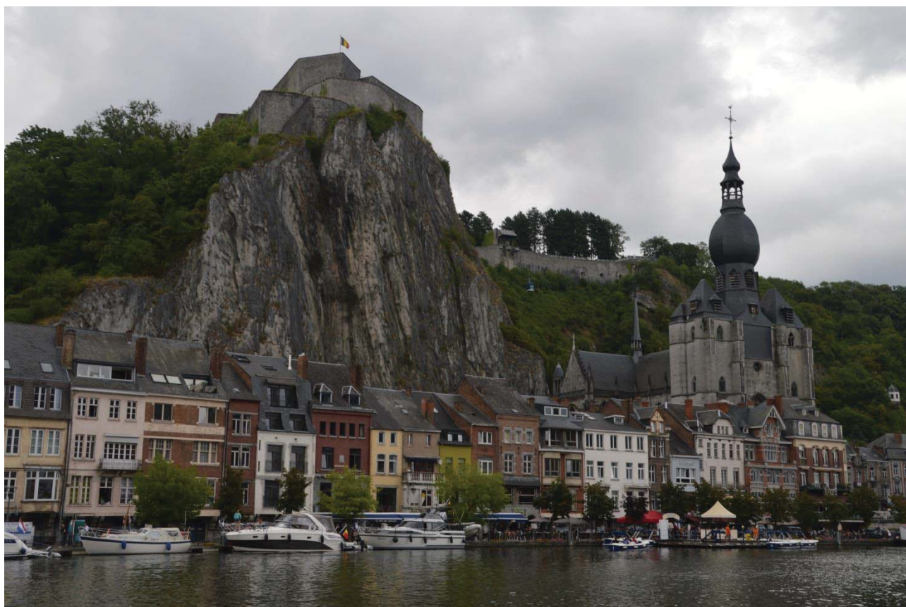
Dinant set fra båden

Søndag morgen videre, det er overskyet og der kommer nogle byger. Vi havde egentlig overvejet at lægge til i Namur, men valgte at fortsætte til Dinant, som ligger 19 km inden den franske grænse. Denne del af turen er i modsætning tilden tidligere i Ardennerne virkeligt en smuk tur. Byen er en decideret turistby med cafeliv langs bredderne og især 2 attraktioner sætter sit præg på byen, den imponerende kirke samt en højtliggende fæstning, hvor der er 408 trin op. (man kan også tage svævebanen). Vi tager en ekstra liggedag da det er regnvejr