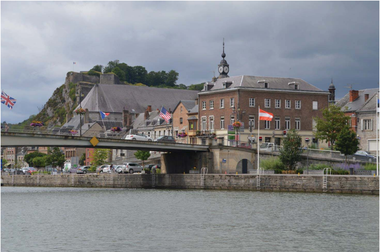
Givet – første franske by

Tirsdag den 21. juli over grænsen til Frankrig, hvor vi i slusen købte Vignet til sejlads på de franske kanaler og sluser. Vi fik udleveret en fjernbetjening, så vi selv kunne agere slusemester. Kort efter slusen kommer vi til den første by Givet en hel fin lille by med en god havn og alle faciliteter