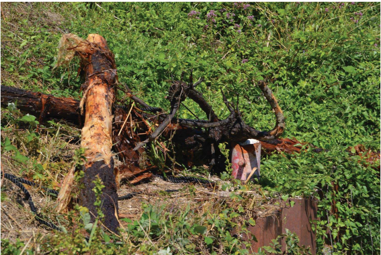
Træet vi slæbte med os