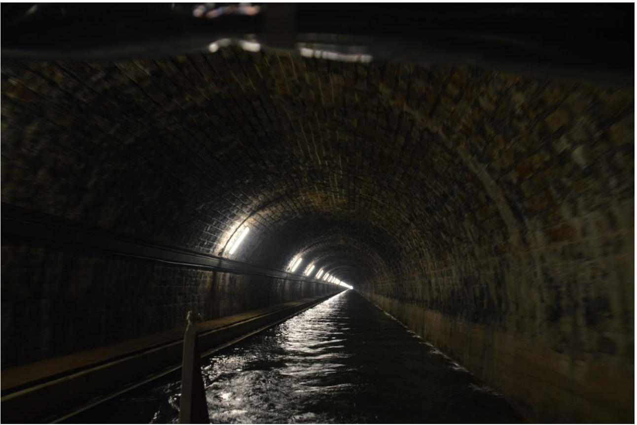
Udsigt i tunnel, ca. 2 km lang

Lige nu er vi stoppet i Langres en rigtig god havn, dog er der 2,5 km. op til byen, som ligger oppe på en bjergtop ca. 200 m over kanalen, og noget af det højeste i Vogeserne. Det var en hård og varm tur op, så et glas kold fadøl på torvet gjorde underværker.