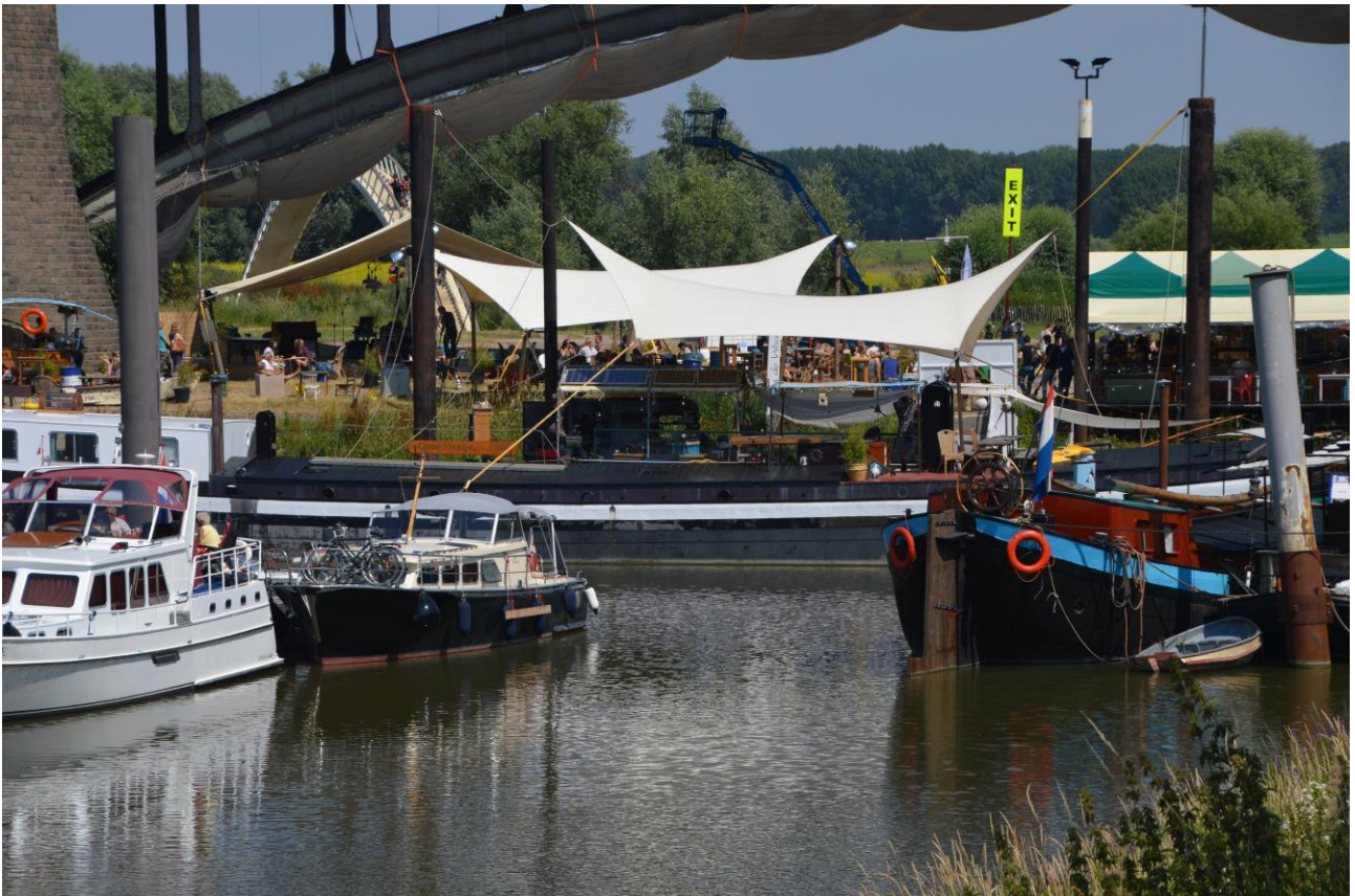
Havnen i Nejmingen

Mandag gik turen ad Mittellandskanalen ned til Wesel-Datteln kanalen hvor vi sejlede ned til Dorsten og efter 2 dage her videre til Friedrichsfeld lige inden Rhinen. I Datteln kom vi i snak med nogle jyder og fortsatte sammen med dem næste dag ud på Rhinen til Wessel. Vejret var blæsende og modvind så vi gik allerede ind her. En enkelt sluse denne dag. Om aftenen spise vi afskedsmiddag sammen i Arli, idet jyderne skulle norover i Holland og vi sydpå.