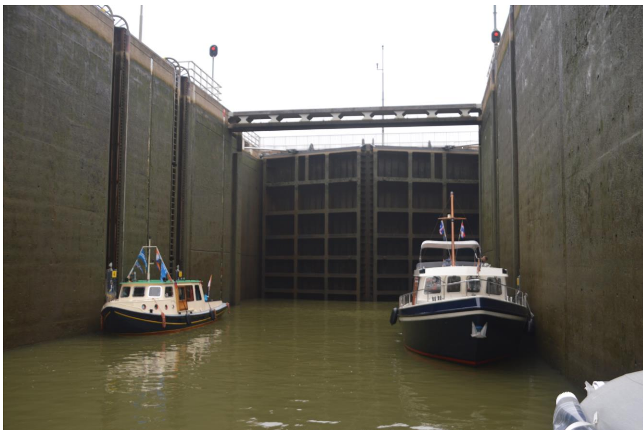
Go' plads i slusen

Søndag videre til Roermond et godt hug på ca. 65 km., hvor vi havde fået at vide der var til at få nogle reservedele, som vi stod og manglede. Der var problemer med både vand og olie i bunden af motorrummet. Olielækagen var lokaliseret - et knækket oliestandsrør på den ene diseltank. Ved adskilles af ferskvandpumpe og hydrofor viste det sig, at der var en materialefejl ved hydroforen, det blev ordnet med det samme i Roermond, mens oliestandsglasset måtte vente til Maasbracht, en by ikke så langt efter Roermond. Her fik vi de sidste reservedele og har nu et fint rent og tørt maskinrum.